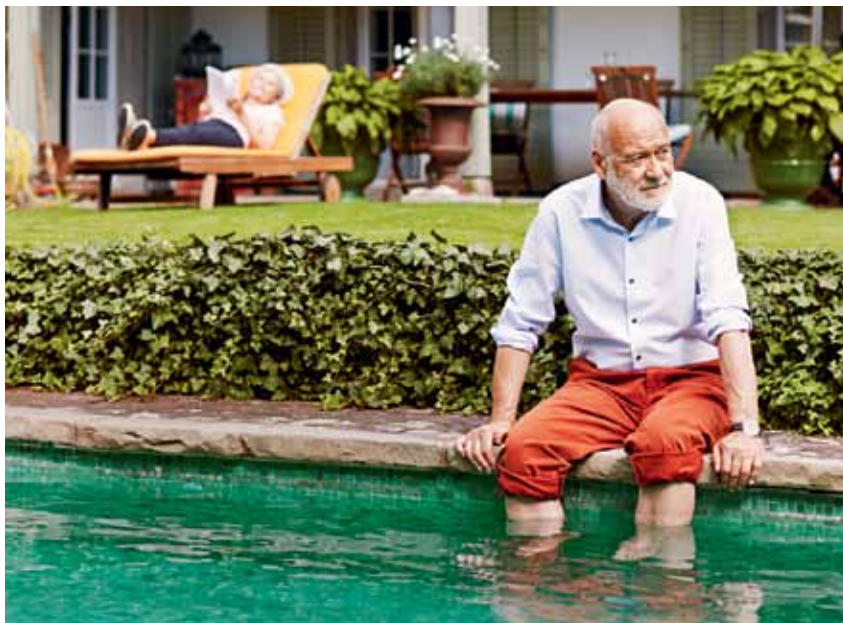
La propriété du logement, au cœur de la prévoyance.

La prévoyance et la propriété du logement ont encore d'autres points communs: elles s'inscrivent toutes les deux sur le long terme. Une raison supplémentaire de les associer et de les