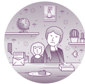
Nella curva bassa