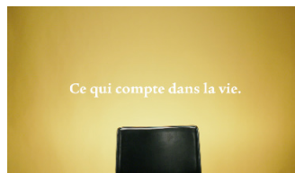
Ce qui compte dans la vie