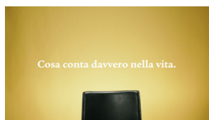
Cosa conta davvero nella vita